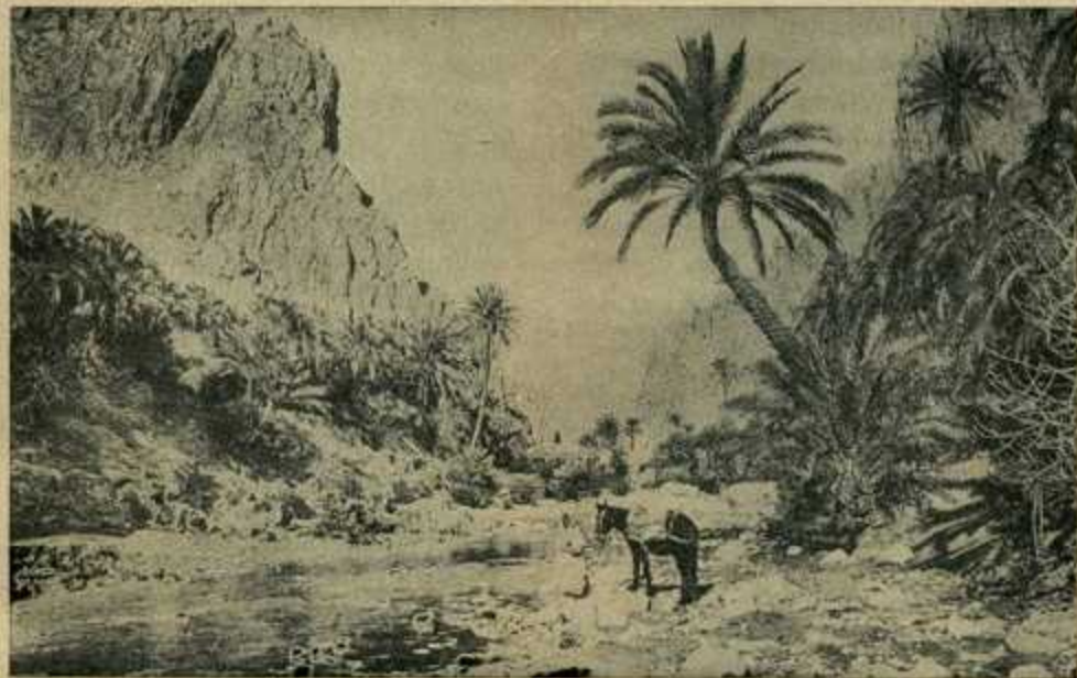
L'oued et les gorges d'El Kantara

Selon la direction de leurs cours, on peut distinguer : les rivières méditerranéennes, les rivières des Hauts Plateaux et les rivières sahariennes.