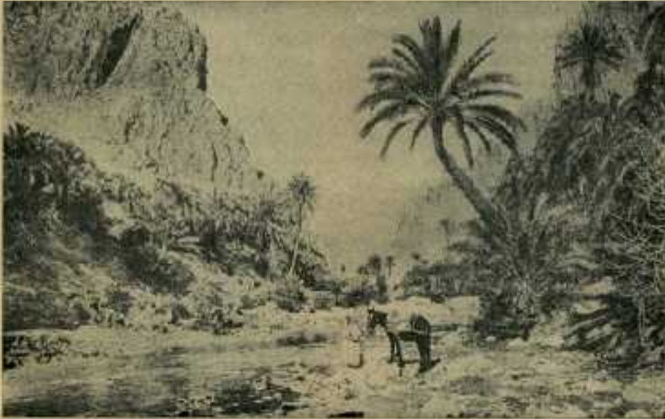
L'oued et les gorges d'El Kantara

Selon la direction de leurs cours. on peut distinguer : les rivières méditerranéennes, les rivières des Hauts Plateaux et les rivières sahariennes.