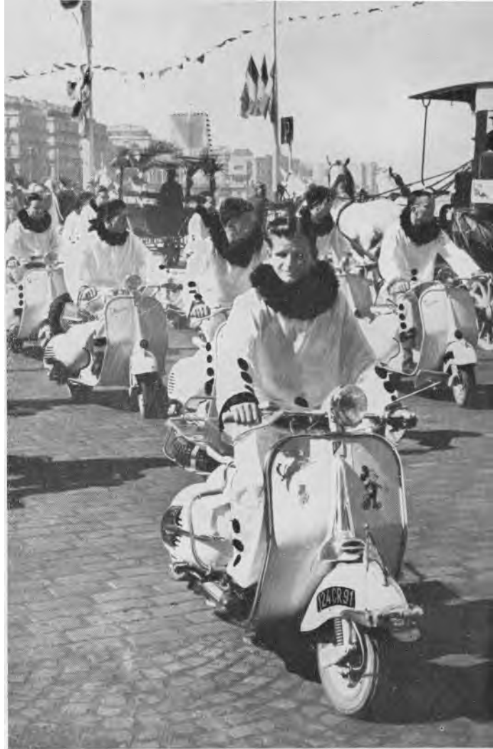
Ci-contre : Cet essaim de pittoresques Pierrots a, pour défilé, troqué la mandoline pour le très moderne scooter.