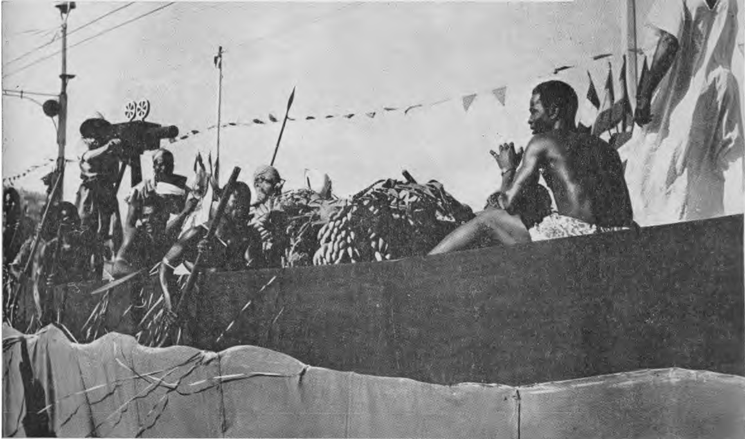
On a fort applaudi " Les Piroguiers de l'Ogooué ", composition pleine de vie et de naturel (s), qui a obtenu un Grand Prix d'Honneur.

LES belles fêtes publiques gardent toujours la faveur de la population. Record d'affluence et d'entrain, le grand Corso fleuri organisé par la Municipalité « sous le signe de la chanson », en fournit l'éclatante preuve.