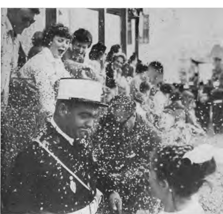
La bataille fait rage : l'agent de service, fort exposé, est particulièrement visé !