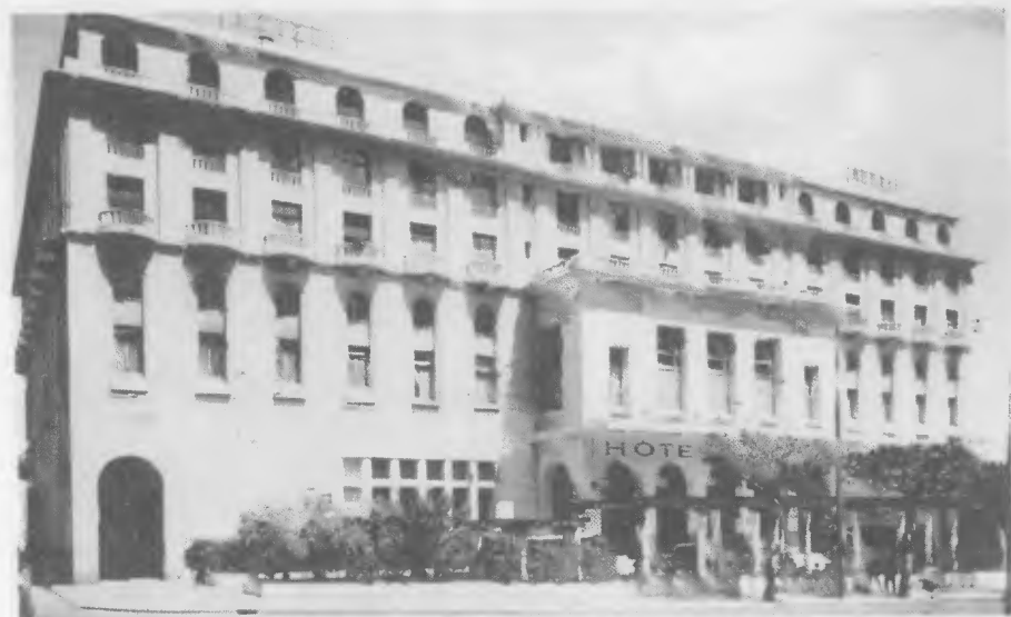
275 - ALGER - Casbah Moudjahid - Rue de Constantin