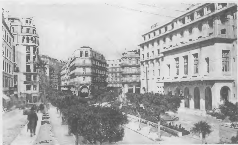
502 ALGER. — Hôtel Aletti (A. Bluysson et Joachim Richard, arch.) Rues de Constantine et Liberté.

Façade à l'angle des rues Waisse et de Constantine. Superficie : 4 300 m2 environ