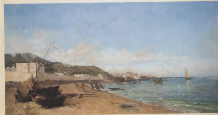
« Vers Notre-Dame d'Afrique » (coll. part.).