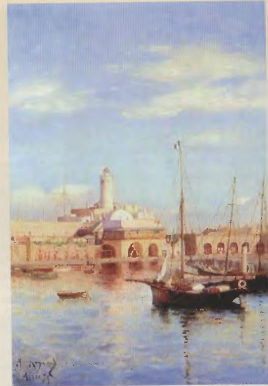
« Le port d'Alger » (coll. part.).

Cependant, en artiste complet, Reynaud ne s'est pas limité à ce type unique de sujets maritimes et, parmi ses motifs les plus réussis, on aime ses doux pay-