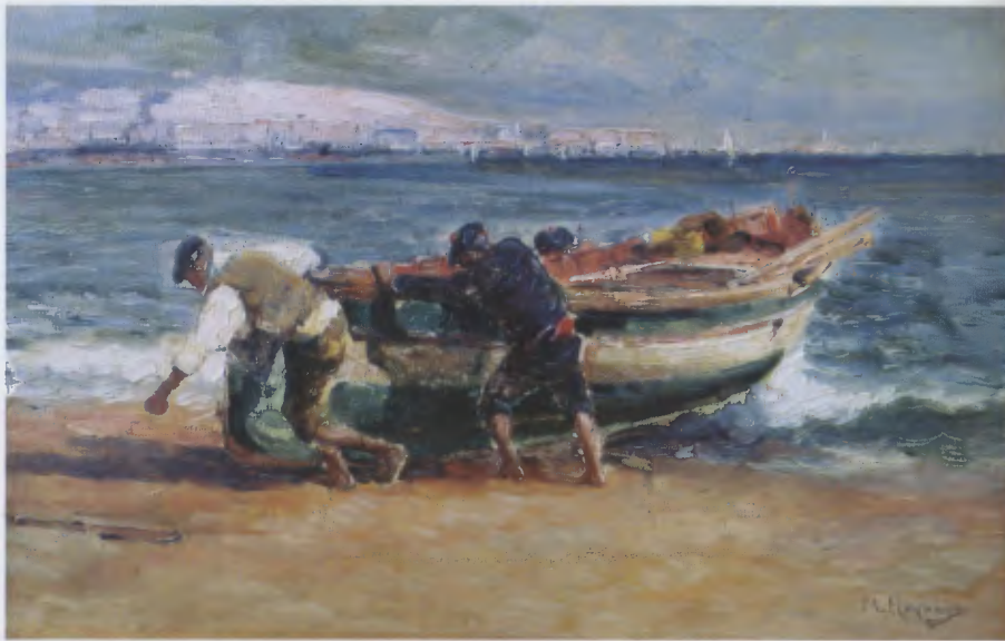
« Pêcheurs tirant une barque » (coll. part.).

l'Algérie à l'Exposition Universelle de 1900 », le Gouvernement général commande un panneau décoratif particulièrement apprécié: « La Récolte des dattes à Biskra ».