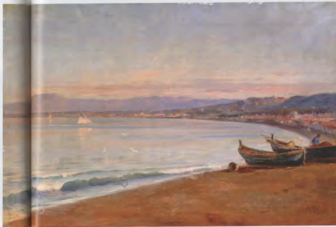
« Les Sablettes » (coll. part.).