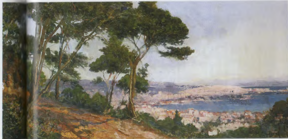
« Baie d'Alger vue du chemin des Arcades » (Musée national de la Marine, Toulon).

Marion Vidal-Bué 150 rue de Longchamp 75 116 Paris courriel : vidalbue@hotmail.fr