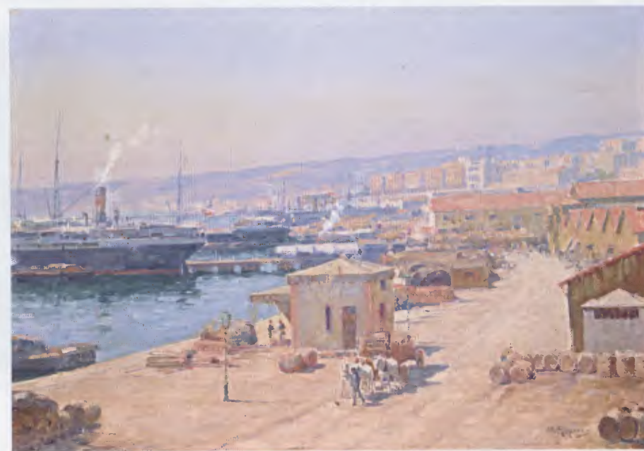
« Le port d'Alger » (coll. part.).

A Paris, l'inspecteur général du Service de santé s'adresse également à lui pour offrir une toile destinée à décorer la salle d'honneur du Val-de-Grâce, et c'est encore à lui que « désirant décorer splendidement le Pavillon officiel de