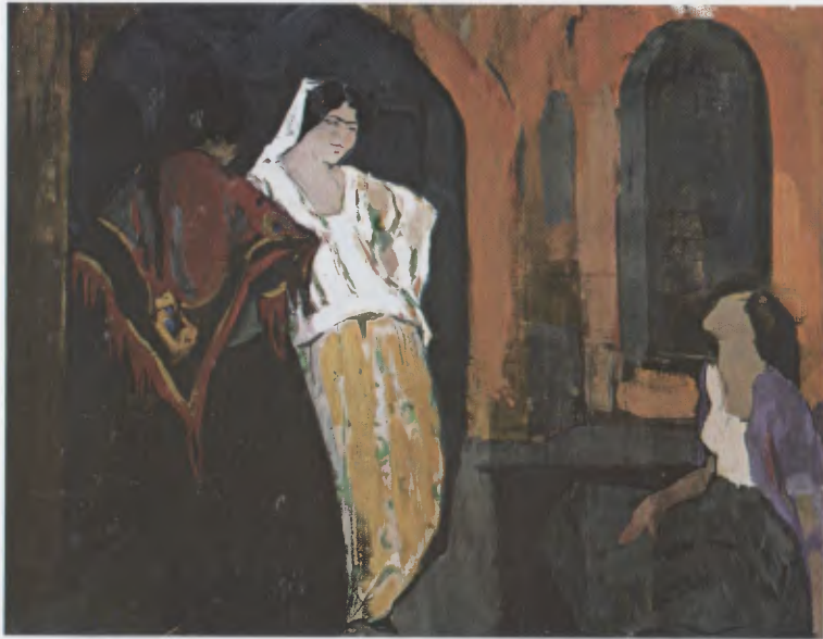
« Femmes juives dans la Casbah d'Alger » (coll. part.).

L'Action africaine: « Danseuses et tons rouges sont aussi réunis dans la toile de Dabat, qui a obtenu une médaille d'argent, et dont la puissance de facture est de premier ordre. Là, il ne faut pas non plus rechercher d'expression; tout le talent réside dans la force des coloris, rarement poussés à une telle violence, et magnifiques. Il faut imaginer cette muraille peinte en vert fort, sur laquelle se détache une silhouette vermillonnée coiffée d'un châle rose, et qui fait des mouvements de danse lente; le reflet des sequins d'or, des bracelets d'argent: les figures brunes vivement maquillées; tout cela en teintes fortes, mais non claires, épaisses, comme vernissées, pour arriver à évoquer l'originalité de cette peinture à la fois terre à terre et éclatante qui est du réalisme exacerbé, d'une puissance de facture rare » (4) . Au Salon d'Automne d'Alger, en 1913 toujours, le commentateur des Annales Africaines distingue parmi les tableaux les plus intéressants les « Femmes arabes » de Dabat, « des merveilles d'attitude et de couleur », et juge ses gouaches « éblouissantes » (5) .