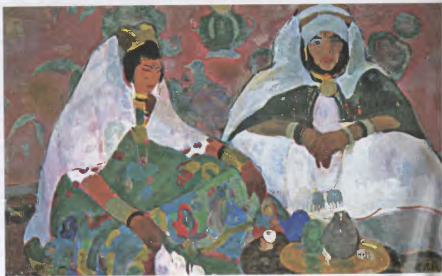
« Femmes dans leur intérieur » (coll. part.), extrait de L'Algérie du Sud et ses peintres , de M. Vidal-Bué,

Si parmi les lecteurs de l'algérieniste il s'en trouve qui possèdent documents, souvenirs ou œuvres de sa main, ils seraient très bienvenus de contribuer à compléter cette enquête sur celui qui fut reconnu de son temps comme l'un des meilleurs peintres algériens.