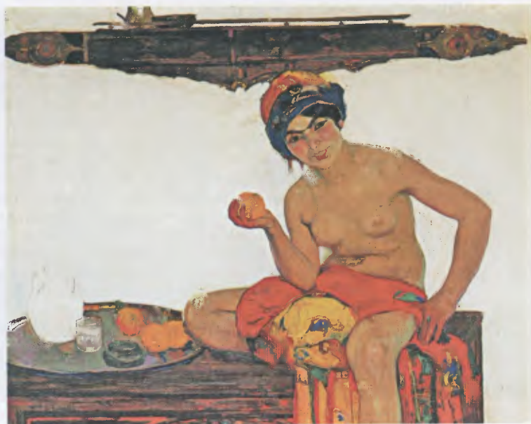
« La femme à l'orange », détail, (Bourg-en-Bresse, musée de Brou).

8 - Gouache passée en vente par l'étude Saint Germain-en-Laye, enchères, Maîtres Schmitz et Laurent, le 7 octobre 2007.