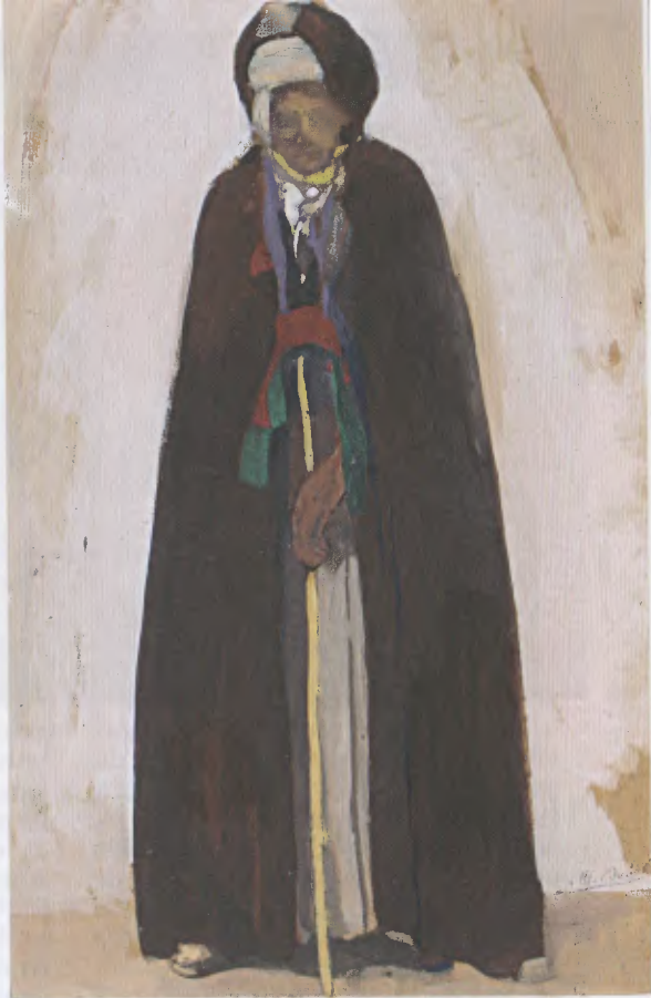
« L'homme au burnous » (coll. part.).

En 1900 ou début 1901, il effectue le traditionnel voyage d'études en Italie, puisque au Salon de 1901, il propose deux sujets pris à Venise: « Veneziana » (La Vénitienne) et « Fondamente dei Mori à Venise », (le Quai des Maures, un endroit qu'il choisit certainement avec malice pour sa résonance africaine!).