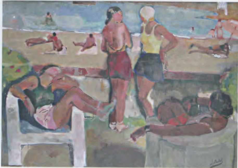
« Les shorts » (Fonds municipal d'art contemporain de la ville de Paris, COARC, dépôt d'Ivry-sur-Seine,).