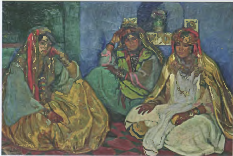
« Femmes de la Casbah, Alger » 1911 (coll. part.).