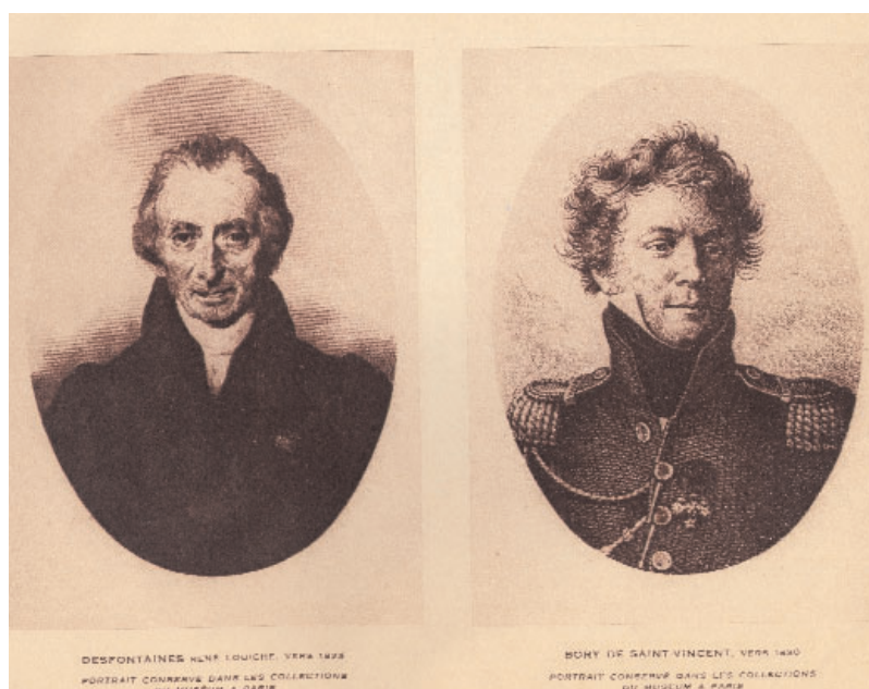
René Louiche Desfontaines (à gauche) et Bory de Saint-Vincent